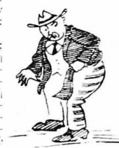
Πρώτος κάθησαν ένας παχύς και μεγάλος πατριώτης