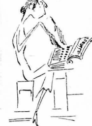
Φοροροστ, φοροροστ, φοροροστ ή γραφοροστ, χαρτί της Νομαρχίας