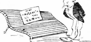
Ήταν ο μόνος υπάλληλος του κράτους που έκαμε εκείνη την ημέρα το καθήκον του