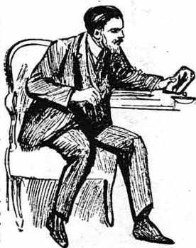
Τὴν κίτταζε μὲ στοργὴ ὀλόκληρη τὴν ἡμέρα...