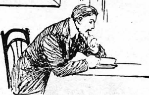
Ὁ Μορώ φαινόταν βυθισμένος σὲ σκέψεις...