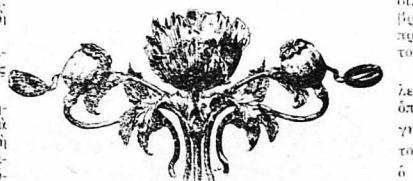
Τ' όθος του δηλητηριώδους ήμκονος, από τόν όποϊον γίνεται τ' όπιο.

Πολλοί άκόμη τις κάνουν πριν πάνε στη δουλειά τους, για να τους περάση ή νοσηρότης, τήν όποια έπίσης προκαλεί ή μορφίνη. Έτσι ο καθηγητής κάνει τήν ένση του πριν πάη στο μάθημά του, ο ματσοί πριν άρχισή τή έπιπέφασ του, ο πολιτικός πριν πάη στη Βουλή ή σε συμβούλιο.