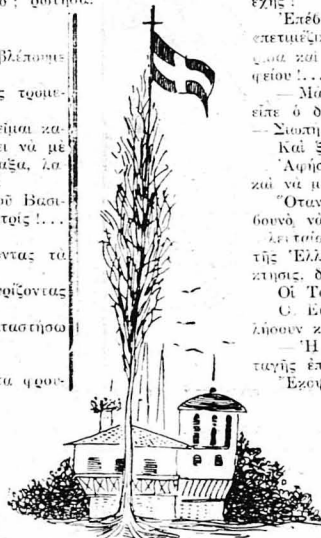
Περιήφανη ξεδιπλώθηκε ή... μελανόλευκος!...