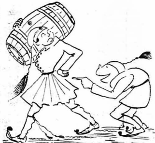
Ο Σπρωτάγωρος πήγανε ξεπίσω του και τιν κορόιδευε