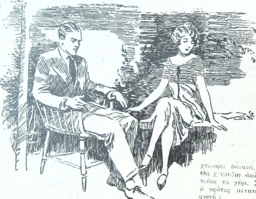
Ἦσαν κι' οἱ δυὸ ἐξαιρετικὰ ἀνήσυχτοι...