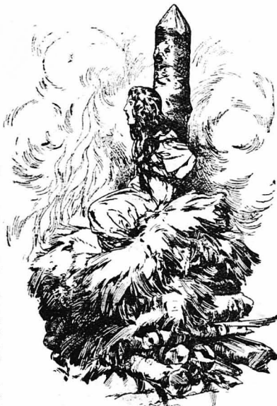
‘Η Βαλέντια κήκες ζωντανή

‘Ο ‘Αντόνιο έμνε έκεί τέσσερα χρόνια κ' έπειτα ξαναγώρησε στη Βενετία. ‘Αλλά μόλις γώρησε, ό γέρο-Γκραντενίγιο, που έννοσισε να εκδιζηθί με κάθε τρόπο, τον κατήγγειλε στο Συμβούλιο των Τριών ότι είχε άσεδήσει προς αυτό, παρζώνοντας άσυλο σε κάποιον Βεστογαίο, καταδικασμένον σε ισόθια έξορία. ‘Η κατηγόρια ήταν άληθινή, ήταν βαρεία και παρ' όλη την εγγλω-