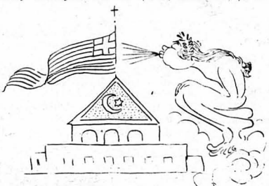
Η αύρα τής ελευθερίας εθώπευε τήν κνωό-λειον...