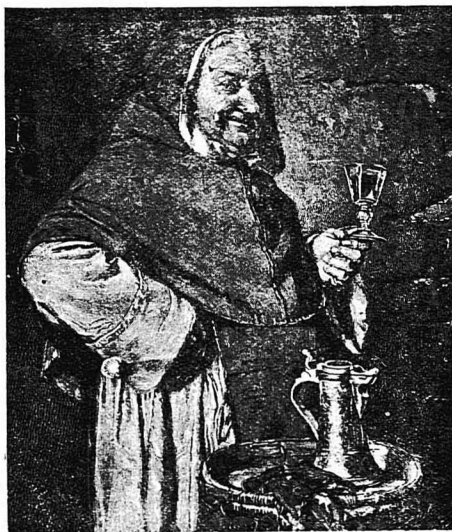
Ένα ποτηράκι κρασί...