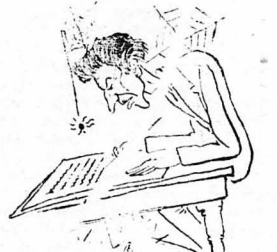
Άράχνες κρομόντουσαν παντού!...