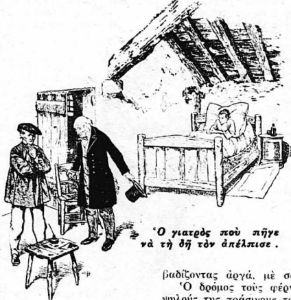
Ο γιατρος που πήγε να τη δι τον άπέλιπσε.

Ο Μάρκος άκοιυθει το νεκροκρέββατο κάποις πιο σικφτός από πριν. Το νεκροταφείο ελ-