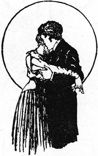
Καλέ μου!... Καλέ μου!...