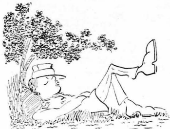
— Μιμμιμ!... άκούστηκε άξαφνα.