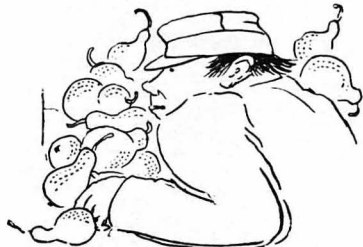
Πισὸ ἀπὸ ἕνα σπορὸ ἀπὸ άχλόδια

Στῆς τελευταίας Κριμαϊκής τὴν ψευδομάχη ὁ Μιχαλάκης έξηφανίσθη παραδόξως. Επὶ άρχε τῆ ώρα πολλοί άνδρες τὸν είχαν ἰδή νά παρακολουθῆ τῆ γαμμη τὸν έπιτηθεμενον, κατὰ τὸν ἐπὶ τὸν Τουρκουβουγιαν έχθρικῶν δυνάμεων.