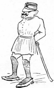
Τὰ δωμάτια είνε νοικιασμένα

Φανταζόντουσαν τὸν Μιχαλάκη, τὸν Μιχάλη τὸν άγατητό μας, τὴν δροσιά αὐτή του λόχου, χτυπημένο και άιμόφυρτο, νά σπαράξει σαν ψάρι στο έδαφος. Τὸν έφαντάζοντε μὸ στασιμένο τὸ κεφάλι, τὸ στόμα του γεμάτο αίματα και τὰ μάτια γουρλωμένα, νά δαγκώνη τή γη, ἀπό τὸς πόνους και τὴν άγωνία. — Εφτάσαμε, Μιχάλη. Κουράγιο, Μιχαλάκη, κουράγιο και φτάσαμε!