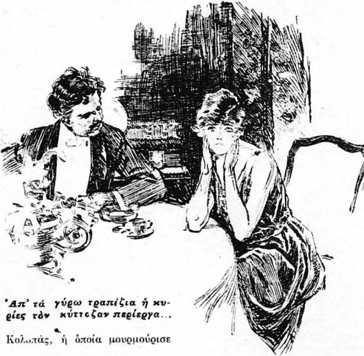
"Ἄπ' τὰ γύρω τραπέζια ἡ κυρία εἶνε τὸν κῦττασαν περιεργα...

Μιά ὅρα ἀργότερα ἡ εὐθνη παρέα ἔκανε και πάλιν τὴν ἐμφάνισί της στὴν πλατεία Πιγκάλ καὶ ἐμπῆκε λοιμωδῶς μέσα σ' ἕνα ἄπ' τὰ κέντρα με τὸν κοῦτσὸν ἀλήτη στὴ μέση, ἀλλὰ μεταμορφωμένον τώρα ἐντέλως. Τὰ ρούχα του Κολοπάς, με τὰ ὁποία τὸν εἶχαν ντύσει, δὲν του πήγαιναν ἄσχημα. Τοῦλάχιστον δὲν του πήγαιναν πὸ ἄσχημα ἄπ' ὅσο στὸν Κολοπάς. Τὸ σκληρὸ κολλάρο τὸν στενοχωροῦσε κάπως και τὰ παπούτσια τὸν ἐστένευαν ἄσχετῶς. "Ὡστόσο δὲν ἤθελε νὰ δείξη τίποτε καὶ ἔκρυβε τὴ στενοχώρια του μ' ἕνα χαμόγελο δεῖλο στὴν ἀρχή