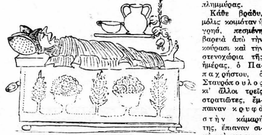
‘Η γοηιά κοιμότανε άπένω.

Έπειδή δέ όλα τὰ θαύματα στην Έλλάδα διαρκούν τρεις ημέρες και τὸ πὸ μεγάλο τέσσερες, ήμεις την τετάρτη έμάθαμε τὸ μυστικό της φασολαδολιμμήμορας.