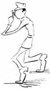
‘Ο ύποδεκανεύς Σταυροπόλιος έπύγαγε οιά-οιά