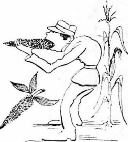
Οί στρατιώτες τρώγαν καλαμπόκια καί χορτάσουν.