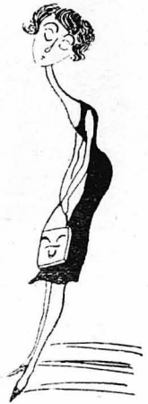
Άδύνατη εκείνη, λιγνή, άλίγον δακρυώδης.