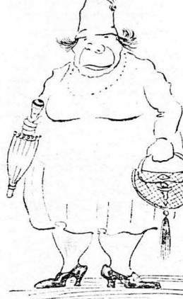
Έφερε καί τή μαμά τού.