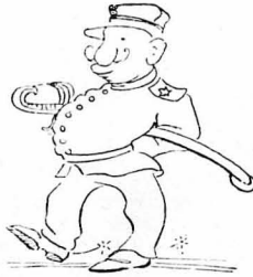
— ‘Αίντε βρε, τι είσαι; όπου-νός τών Στρατιωτικών καί θέ-λεις νά παραιτηθής