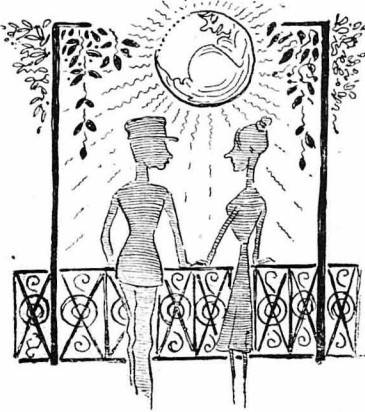
— ‘Ωχ ! ή σελήνη ! ή σελήνη ! Πώς σου φαίνεται ή σελήνη ;