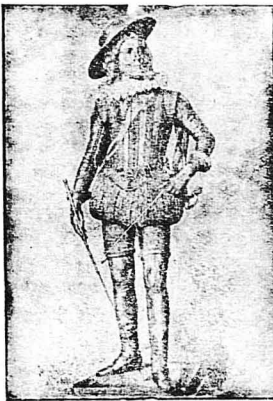
'Ο Λουδοβίκος 14ος εις νεαρά ήλικία