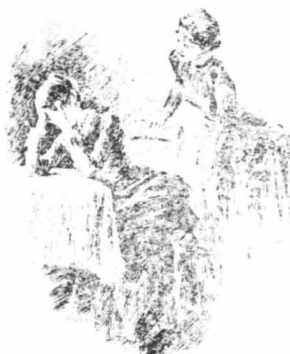
Έκ' αἰετ ἀπαρηγόρητα παρακαλῶντας τό Θεό γι' αὐτόν.

Στήν αρχή τοῦ ακολουθούσε με προθυμία, έπειτα όμως, άγανακτισμένη με τόν ἴδιο της τόν ένοτό, ἀηδιασμένη από την κοσμική ζωή, κλειστική στό σπίτι της, προτιμῶντας την μοναχία του ταίριαζε τόσο πολύ με την φρεσί της κατάστασι.