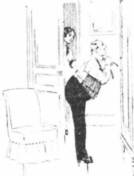
Ὁ Τσερνιακῶφ στολίστηκε μπρῶς στὸν καθρέφτη...