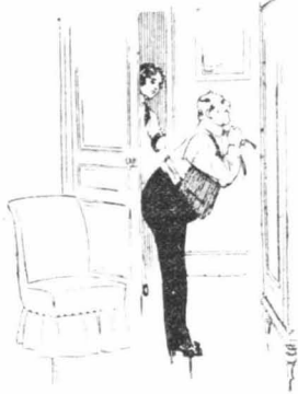
'Ο Τσερνιακώφ στολίστηκε μπρός στὸν καθρέφτη...

Τὴν ίδια στιγμή ο Τσερνιακώφ έννοιωσε και νὰ λυθῆνι μέσα στὸ στῆθος του. Μὴ βλέποντας, μὴ άκούγοντας τίποτε, άπιστοχόρησε πρὸς τὴν πόρτα και σπῆθηκε ὡς τὸ σπίτι του. 'Όταν τέλος έφτασε σ' αὐτὸ μηχανικά, χωρίς να βγάλῆ τὴν καινούργια του στολή, έπαιτίλισε σ' έναν καιπαί... και πέθανε!... 'Ο καιπιὸς τὸν πὸν δέν είχε μπορέσει να «εξηγήθῆ τὸν στρατηγὸν δέν είχε φείει... ANT. ΤΣΕΧΩΦ