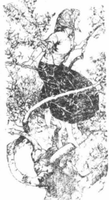
Μιά νεαρή χωριατοπούλα τὸν ἀγάντερε νὰ ζυγώην στὸ χωριό...

Όταν σὺνθη κανεῖς κάτο, βλέπει στὸ βάθος νὰ ἀπορῶν σφοροὶ ἀπὸ κόκκαλα ἀνθρώπων καὶ ζώων, ποὺ τὰ τραβᾶει κάτω τὸ οὐμητιζὸ νερὸ. Οἱ ντόπιοι εἰσὶς λένε διτὶ κάποτε, ποὺ γίνηκε μεγάλη πλημμύρα στὴν κοιλάδα, τὰ νερά ἐγένεσαν τὸ βάραθρο καὶ τότε συνέβη κάτι περίεργο: Στὸ στόμιον τοῦ βαράθρου σχηματίστηκε ἕνας βαθὺς νεοστροφῶλος. Τὰ νερά, μαζὺ με ὅ,τι εἶχαν παραμῆνει, ἐπιτοφρογίζαν δαμονιοθῶδες καὶ τέλος οὐροφύονταν με βροντὸν καὶ ῥόγχο, σὴν νὰ τὰ κατάνησιν στόμα τέραςος τῆς Κολάσεως!... Ἐταῖα, γίνονταν τὸ ἀντίθετο: ΄Ο νεοστροφῶλος ἀνέβαινε ἀπὸ τὸν λάτο τοῦ βαράθρου, ὅπως ἡ φωτιὰ τῆς Αἴγνας καὶ Ἐρονοῦσε, ὅπως ἡ Χάρυδδις, τὰ λείψανα ποὺ ἔπησαν στὸ βάραθρο! Σὲ μιὰ τέτοια πλημμύρα ἀνέβησαν στὴν ἐπιάντην καὶ Ἐσχρήκη σὴν στὴν κοιλάδα πλήθος κόκκαλα μὲν με σαρπιμένες σάρκες καὶ κρᾶνιά ἀνθρώπων καὶ ζώων, ὅσους σὴν τὸ γιόν!