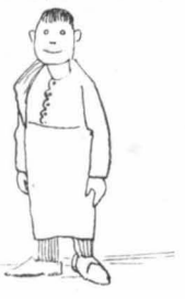
Εἴμαστε Κεφαλλονίτες, νανατῆ !...