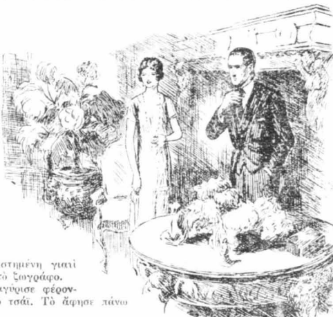
Τραβήχτηκε πρός την άκρη τής κούμαρης κ' έφριξε μια ματιά στην έργασία του.