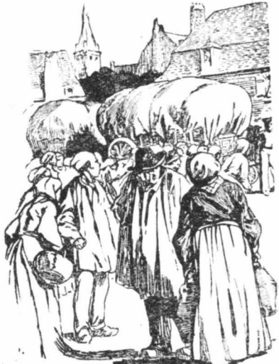
Βγαίνοντας απ' τον έσπερινό τραβήξα γιά τον "Αι Τρεζανέκο...