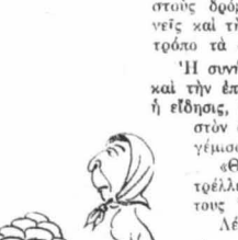
Ἡ νοικοκυρὸς φέγγανε τ' ἀγῶνα