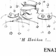
Ἡ Πούλια !...