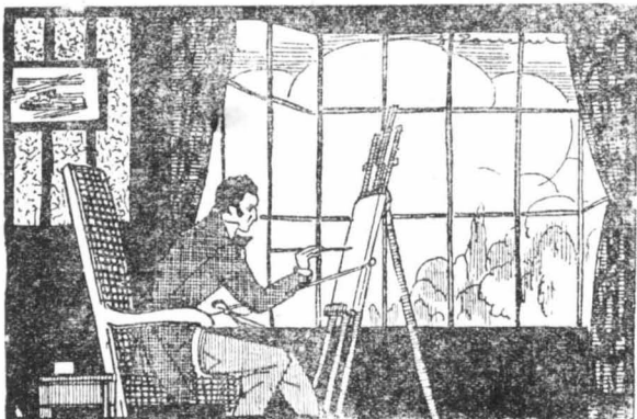
Τόν έβλεπε με την φαντασία της καθισμένο μπρός στον όκρίβαντά του νά ζωγραφίζει...