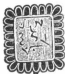
Κινέζικη βεντάλια 1400 ετών.

Η βεντάλια έλλεξε και τώρα. Η αρχαιότερα βεντάλια που διεσέθη μέχρι σήμερα. Η βεντάλια στους Αιγυπτίους, στους Κινέζους, στους Ινδούς. Η Έτρουσκική βεντάλια. Όπου χρησιμοποιείται και για το άνωμα της φωτιάς. Η βεντάλια στις έγκλησεις. Η Ρωμαϊκή αερίστριες. Η βεντάλια στην αρχαία Ελλάδα. Η βεντάλια σήμερα. Είς άχρηστία κ.τ.λ. κ.τ.λ.