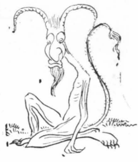
— Παναγία μου είπα. Σίγουρα θά είπ’ ό Σατανάς!