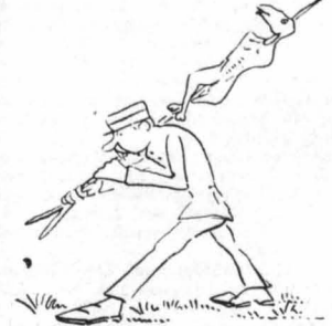
— Τι τ ά θέλτεμας, έπέρασα καλά!