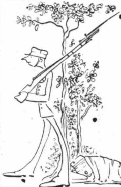
‘Αμα στήσαμε προφυλακή πέσαμε νά κοιμηθούμε.

ζωή, τι θά πή στρατιώνας και πειθαρχία. — Μιά φορά μονάχα, βρέ παιδίσι, τούς έλεγε, φοβήθηκα στον πόλεμο, και τον φόβο μου αυτό ποσά δεν θά τον λημονήσω. — Στο Μπιζάνι; τον δίκωμον ένας. — ‘Οχι, άπάντιμε αυτός γελαστός. Άκούτε νά εός τ ό διηγηθώ. ‘Οπως σάς έλεγα λοιπόν, δεν φοβήθηκα ποτέ μου, ούς τις σφιρίδες που σφίριζαν εάν διαβόλοσι σ’ αυτά μας, ούτε τις ποροβόλα που τρανάζαν τον τόπο, ούτε τά πολυβόλα που θορίζαν, ούτε τις όβριδες που άνοιγαν κάτι μεγάλες, τέτοιες, τρύπες στη γή, ούτε τις χολέρα που μά είχε πιάσει και μάς πέθαινε, ούτε τις βροχές, ούτε τούς κόπους και τ ά χρογία δεν φοβήθηκα τ ό μά- τι μου, ούτε την πείνα, που μέρες είχαμε νά βάλουμε ψήχουλο στό στόμα μας, ούτε και τίποτε άλλο, ό ένα... — Τι ένα; ρώτησαν όλοι. — Τι ένα λέει; Άκούτε νά τ ό μάθετε. Είμαστε κοντά σ’ ά Βουλγαρικά σίνορα ένα βράδι. Νυχτώσαμε μέσα σ’ ένα βουνό ψηλά και γεμάτο δέντρα άγρια και πυκνά. ‘Η φύσις γύρω ήταν βαρεία, σού έκοβε τ ό αίμα, σάν έπαιγνε και νύχτανα κ’ έσφαταν ό ίσκιος. Άμα στήσαμε προφυλακή, έπέσαμε άμέσως στόν ύπνο. Κου- ραμένοι, τασιμαμένοι καθώ; είμαστε, τόν πήραμε ά- μέσως. ‘Εγώ είχα γείρει σ’ ένα βουβουλα. — Τι βουβουλα; — Βαθούλαμα μαρέ! Θά πώπετε λοιτούς; Γιατί με διακόψετε και χάνω τ ό... συρμό τών ιδεών μου; Εί- χα γείρει λοιπόν, που λέτε, σ’ ένα βουβουλα κάτω άπό τ ά κλαριά μιάς άγριοκορομηλιάς, και ό ύπνος με πήρε στό μου έντρο, πεθαιμένος καθώ; ήμουνα. Άπάνω στόν οφρανό ήσαν ένα φεγγάρι σάν ήμέρα. Δεν είχε περάσει όμως