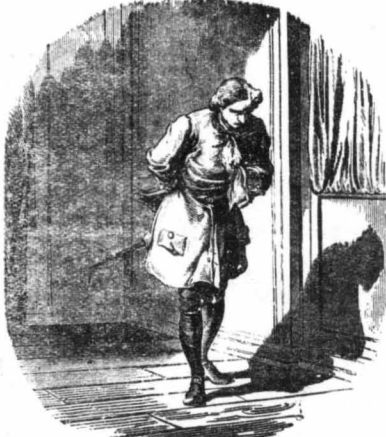
Ό λογαγός τής φρουράς που παραφύλαγε πίσω από την πόρτα...

Ήταν ό φρουροί, που φυλάγαν το βασιλιά τής Γαλλίας. Μόλις ό Λουδοβίκος άμουςε αυτή τή φωνή, πήρε θάρρος και φώναξε με όση δύναμη είσε: — Βιθηά! Βιθηά! Μα σκοτώθην!... Ό λογαγός τής φρουράς που παραφύλαγε πίσω από την πόρτα... Μα ό Ιερέας, πονη προφήτης ό Λουδοβίκος, να άνοιξη το στόμα του, είσε στον λογαγόν. — Δέν είναι τίποτα! ό βασιλεύ; φωνάζε έπίτηδες για να ίδθ άν πράγματι τον φρουρησει καλά. Μπορείτε ν' άποσυρθείτε. Ό λογαγόν: χαίρετές κ' έφυγε. Ό βασιλεύ; έμεινε με άνοιχτό το στόμα από την κατάπληξη. Δέν μπορούσε να έξηγήσει τή σίαση του Ιερέως. Μα και ό νέος τον κιντάζε κατάπληκτος. Τέλος, ό Ιερέας, άπαρά νός να λύση τή οισαπή και να δώση τις έξηγήσες που παρμιεμαν από αυτόν. — Αν άπάχη έδδ μέσα ένος έννοχος, είσε στο βασιλιά, υπότος είσε σεις, Μεγαλειότατες. Ό άνθωπος αυτός—κ' έδειξε το νέο—καρτούσε πριν από λίγο τή ζωή σου σ' ά χέρια του. Θα μπορούσε να σέ σκοτώσει. Μα δέν τόκανε. Σε λυπήθ ήσε, ένθ σου δέν λυπήθηκας κανένα δέ; τώρα. Ό Θεός λοιπόν θα τον συγχώρησι για τή χειρονομία του, όπως τον συγχώρησ' ή έγώ!... — Ό Θεός δέν συγχώρηστέ εγκληματίας! είσε ό Λουδοβίκος, χωρίς ν' ή καταλαβίηνη ότι μ' αυτό που έλεγε καταβίαζε μόνος του τον θάνατο του.