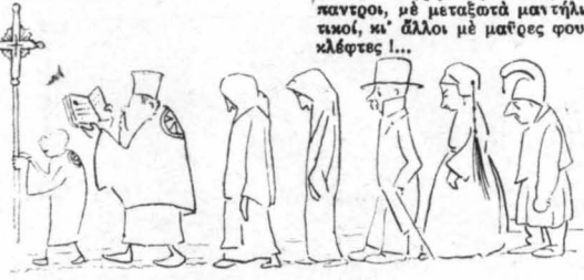
Όταν ή πομπή ξεκίνησε