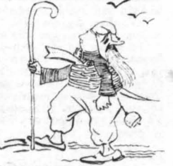
Οι μασκοράδες γούριζαν μ' άναποδα τις προσωπίδες