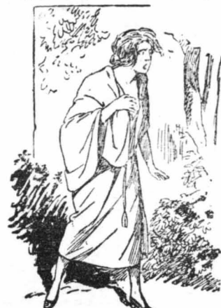
Έσταθήσε κ' έσφιξε το στήθος της για να συγκρατήση ένα λυγμό.

Η όμα είνε το πιο φρόνιμο άπ' όλα τα έρπετά. Ουδέποτε επιτίθεται όταν δεν την ένοχλήσουν. Σπανίως η σχιδόν ποτέ δεν διαγκώνη μικρά παιδιά. Συνήθως βρίσκει μεγάλη εχθροσύνη να κινείται τα πολύχρωμα άνθη, γι' αυτό κρηβαται πάντοτε κοντά σε τόπους όπου υπάρχουν άνθισμένες οροδοσάρφες. Ο μεγαλειότης έξθρος της όμάς είνε τα μεγάλα μαύρα φιδιά. Το μόνο δει πράγμα, που τις άποκαρηνει από ένα μέρος, είνε η μυρωδιά του σκόρδου και το μόνο πράγμα που τις προσελκύει είνε το γάλα.