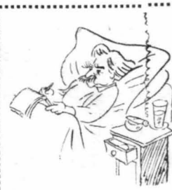
‘Ο Μάρκ Τουαίν σὺν κρηββάτι του. (Έξήν γελοιογραφία)

‘Αλλ’ ό Μάρκ Τ. ναίν δέν άκνε παιά. Τόν έχοιρθέσε ευγενισιατα και έταγνε για να σταματήση στο πλησιέστερο έστιατόριο. ‘Η κοιλία του διομαρτίρετανε πολι-πολή έντονα τώ γ.κ. Κ’ έννοείται ότι έφρονινα να τήν ικανοποιήση με ένα ήγεμονικώτατο γεύμα !