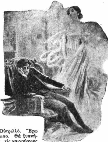
‘Οπτασιές και όράματα τών έφρασίανζαν διαρκώς...

‘Από τό 1924, άρχισε να δημιουργείται μεγάλος θόρυβος, γύρω άπό τό όνομά του, χάρις στις έ-