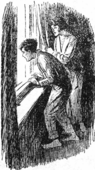
Όλοι κούταζαν έξω τρομαγμένοι

Έξαφνα μιά άναμαλλιασμένη γυναίκα, μέ τά μάτια φλογερά και τό πρόσωπο ξαναμένο, έσπρωξε τον κόσμο ποστεκε μπρός