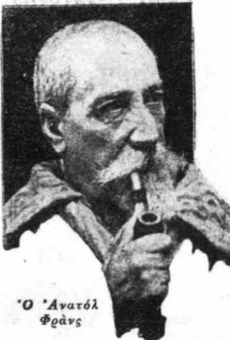
Ο Άνατόλ Φράνς