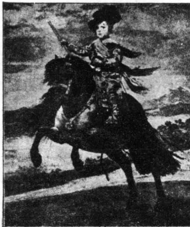
'Ισπανός Πρίγκιπ (Έργο τού Βελάσκουεθ)

Ο Βελάσκουεθ ξαναγύρισε στην Ίσπανία μ' ένα πλοίο φορτωμένο από άνευκμητόμο θησαυρούς τής τέχνης, γιαι έφερε μαζί του,