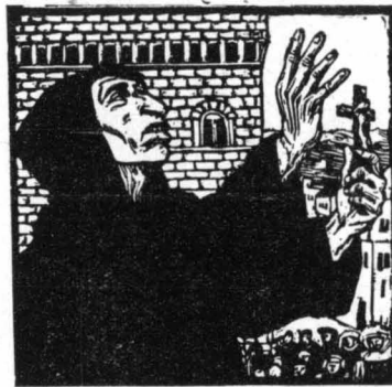
Ο Σαβοναρόλε (Παλιή ελουργραφία)

Ο Σαβοναρόλε έφυγε από τήν πλατεία με τούς μαθητάς του, χωρίς νά τούς περιάξη κανείς, άλλ' από κείνη τήν ήμέρα τό γόητρο του άρχισε νά ξεπέφτει και ή αίγλη του νά σοκωνιούθι. Οι έθροί του επλήθυναν και τού άρχισαν έναν συστηματικό πόλεμο. Οι άνθρωποι τού Πάπα και οι άνθρωποι τών Μεδίκων τόν διέσκαπταν