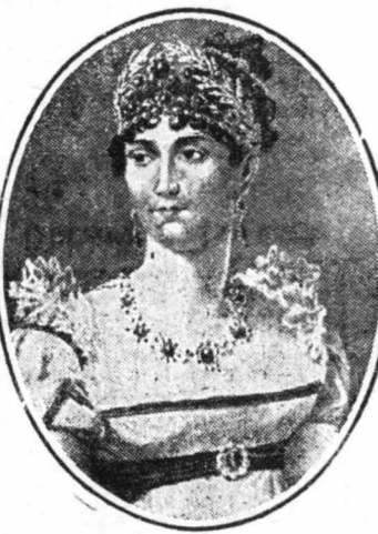
Η κ. Μπωρναί

Μετά τόν θάνατον του Καζότ, ή κ. Μπωρναί, ξανάρχισε νά βλέπει διάφορους εφιάλτες και γι' αυτό, κ' όταν άκόμη έννε αυτοκράτειρα—ώς γνωστόν ή κ. Μπωρναί ήταν κατόν σύζυγος τού Ναπολέοντος—δεν έπευρε ποτέ στο κρεββάτι της, άλλα ξεαλωνόταν και κοιμόταν σέ μιὰ πολυθρόνα !