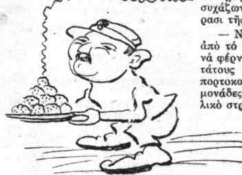
Τού Περικλίους τό στόμα ήτανε γεμάτο.