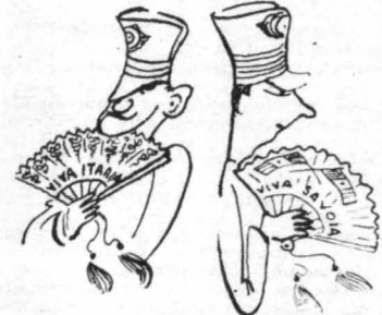
Ο Ιταλικός στρατός είχε και βεντάγιες

Η επιθυμία του, πράγματι, έτελεσθή, και ό εϋγενής Άγγλος πέθανε από άσφυξία μέσα στο κρασί.