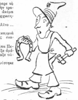
Κατόρθωσε να πεταλώση την Ελλάδα.

Και πράγματι, λουτάρι έγινε ό γενναϊός Ιταλός, την ήμερα πούλασε τόν στρατιωτικό-ύπηρέτη του, τόν Περικλή, να τού τρώη τους κερπίδες.