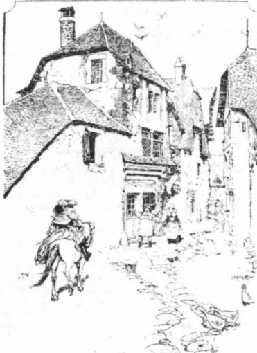
Τὸν συνώδεσε ὡς τὸ πλησιέστερον χωριόν...

Ἐκεῖ ὁ Τρεμιε μὲ τὸν Κοκτοσταυλο δὲν παρουσιαζότανε καὶ τόσο ἐπιχολὴ ὅταν τὴν εἶχε φαντασθῇ.