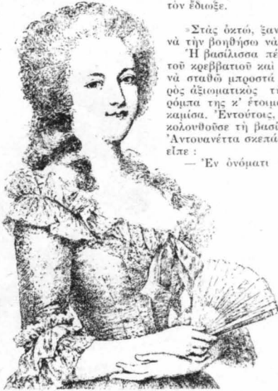
Ἡ Μαρία 'Αντουανέττα