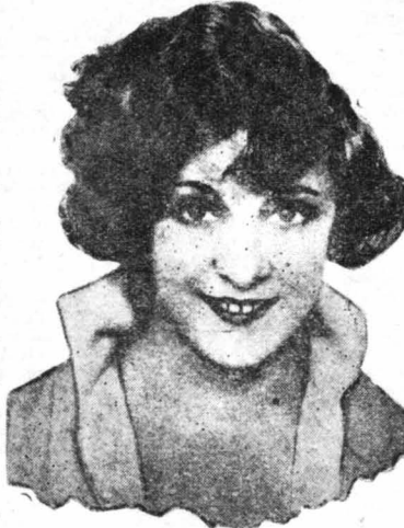
Μία έκφραστική φωτογραφία τής Λο Σάβιτς

— Άρχισα λοιπόν να παίζω στον κινηματογράφο ! Τ’ όνειρό μου είνε πραγματοποιηθεί !