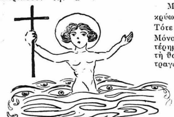
Γεννήθηκε σε θάλασσα δακρύνων...

Μέσ' στον άφρό τής θάλασσας ή αγάπη μου περικαλώ σας κύματα, μη μου Μά το δάκρυ που κάνουμε, εγώ για σένα χάνομαι. Νά ήταν το στήθος σου γιάλιός, και ο λαιμός σου κύμα να πέσω μέσα να πινωθί, κ' άς [Έχω γώ το κερμί !