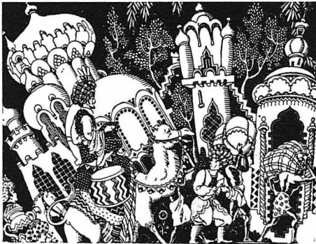
Είσοδος του Μωάμεθ στη Μέκκα

Τό "Κοράνο" δέν τού έγραψε ο ίδιος ο Μωάμεθ, καθώς πιστεύ-ουνε πολλοί, αλλά οι όπαδοί του και οι συγγενείς του. Δέν εινε δέ τίποτε άλλο παρά άποκαλήσεις τού Μωάμεθ, λόγια του, γνώμες, κρίσεις και χαρακτηρισμοί του.