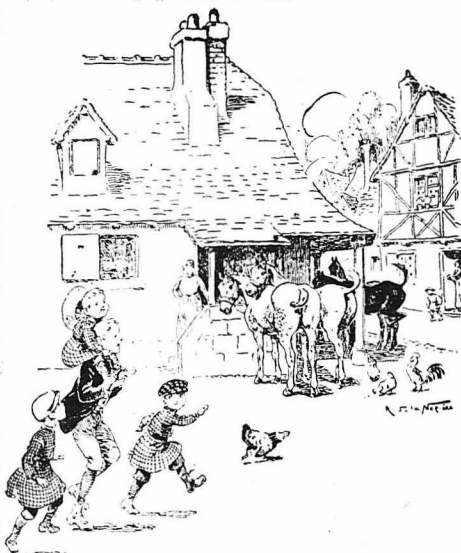
Στην αλλη τὰ παιδιά έπαιζαν χαρούμενα και γελαστά.