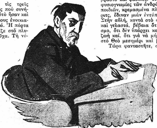
Τὸν εἰς τὸν πάντα καθιστὸν νὰ ἀντιγράφει κάτι

Καί πράγματι, δὲν ἔπερασε μὲ βδομάδα ἀπὸ τὴν κηδεῖα τῆς γυναίκας του καί ὁ συμφορογράφος, στὸν κηδεῖα τοῦ Πουτόκιν, τὸν ἔπαυσε γιὰ νὰ βάλῃ στὴ θέση του μιὰ δεσποινίδουλα. Ἐ, λοιπόν, θὰ τὸ πιστέψετε; Δὲν ἦταν τόσο τὸ χάσιμο τῆς δουλειᾶς του πού ἀπογοήτευσαν τὸν Πουτόκιν, ὅσο τὸ ὅτι τὸν ἀντικατέστησαν μὲ μιὰ δεσποινίδα καί ὄχι μ' ἕνα ἄνδρα. Γιατί μὲ μιὰ δεσποινίδα; Εἶχε πειραχθεῖ γι' αὐτὸ τόσο, ὥστε,