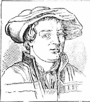
Ο μεγάλος Γερμανός ζωγράφος ΧΑΝΣ ΧΟΛΜΠΑΪΝ

Τα πρώτα χρόνια του μεγάλου Γερμανού ζωγράφου, Μέγας καλλιτέχνης, αλλά δυστυχισμένος σύζυγος. Ο χαρακτήρας της γυναίκας του, Σωστή τιγρίς. Πώς τον διευκόλυνε ο Έρσμορ; να φύγει για το Λονδίνο. Όπου ο Καγκελάριος Μάρος τον κρύβει, ζηλοτύπος. Ο ενδουσιασμός του Βασιλέως. Ένα επεισόδιο. — «Μη μου γγίζετε τον Χολμπάιν, κλπ. κλπ.