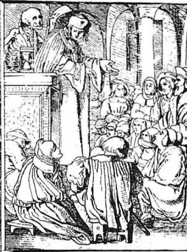
Τα όργανα και ο Έρσμορής

Υστερ' από λίγο, κατέφρασε στ' άνάκτορα και ο λόρδος, ύποστηροζόμενος από δυο ύπρητές του, έπειδή είχανε σπάσει τα πλείονα του και δεν μπορούσε να περπατήσει, με το πρόσωπο γεμάτο έπίδειξη. Ζήτησε άκρόαση από το βασιλέα και όταν παρουσιάστηκε μπροστά του, του παραπονέθηκε για το θάσος και την άναίδεια του γερμανού ζωγράφου και ζήτησε την παραδειγματική τιμωρία του. Έκει όμως που περίμενε να δει το βασιλέα να πέρη με ζση το μέρος του και να διατάσση άμέσως τη σύλληψη και τη βία προσοργη του αδύδους γερμανού, βρθηκε τον Έρσμορ πολύν λίγο διατεθειμένο να