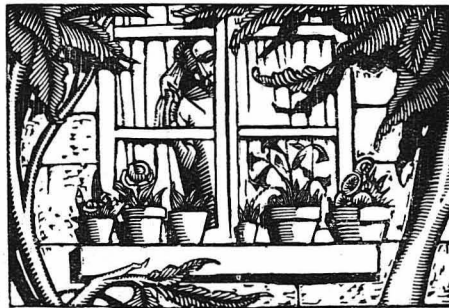
Έτρεξε στό παράθυρο και κύτταξε δξω