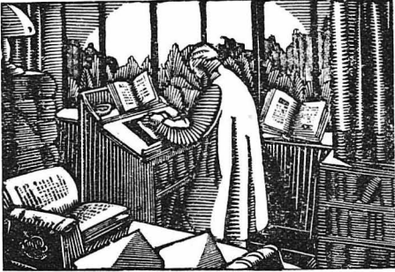
Ὁ ἀνακριτὴς Μαρσεσάλ κῆταξε κάτὶ χαρτιά καὶ κρατοῦσε σημεῖοσιος

Οἱ Πελοπόν, μιὰ ἀπὸ τὶς ἀπειράριθμες φυλὲς τῆς Ἰνδοκίνας, ἄνθρωποι ὀρεσιφιλοὶ κατὰ τὸν εἶστον, τρέφον ἐξαιρετικὴ συμπάθεια πρὸς τὸ μαλακὸ καὶ ἀπαλὸ κρέας τῶν ποτικῶν. Μολοῦν δὲ δὲν εἶνε καὶ τόσο καθυστερημένοι στὸν πολιτισμὸ, καὶ ἔξωρον ὅλες σχεδὸν τὶς μεγάλες ἐφευρέσεις τὸν τελευταῖον χρόνον, ὥστόσο ὡς σπουδαιότερα ἐφεύρεση, κυριολεκτικῶς ἀνθρωποσοσιτῆρια, θεωροῦν τὴν ἐφεύρεση τῶν...ποντικοφαγῶν !