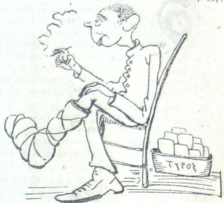
Προσ'ήραξε στην κουτσαμάρα...

Στ'ό τέλος όμως άναγκάσθηκε να σηκωθ'ή και να περπατήση. Μεταφέραμε τ'ή χύτρα στο δίπλανό θάλαμο. Πώς θ'ά κλεφτολογούσε πλέον τυρί ; Και θέλοντας και μη θέλοντας, άλλαξε αρρώστεια.