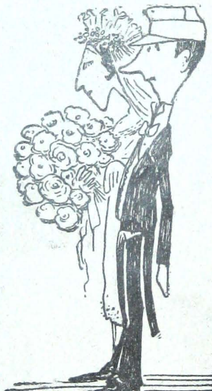
Να παντρευτώ άπόψε !