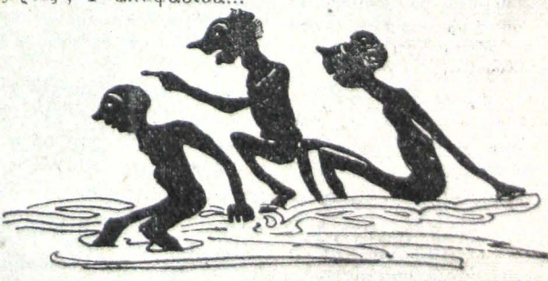
Ο θόρυβος έξύπνησε τους άνδρας...