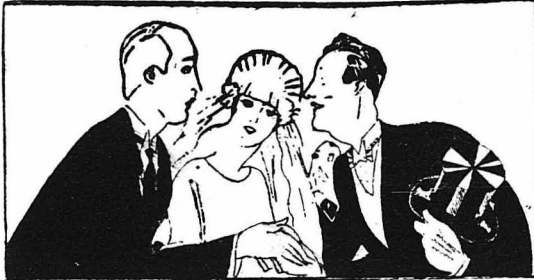
ΠΑΡΑΣΕΝΑ ΚΑΙ ΠΕΡΙΕΡΓΑ