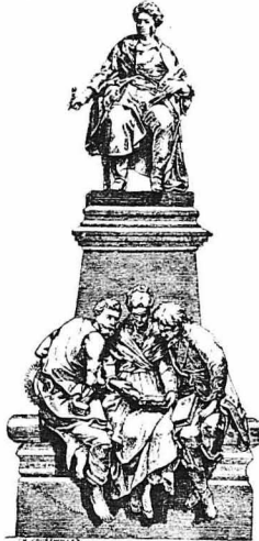
Ο Άλέξ. Δουμάς (Ένας άπ' τους άνδριάντας) του

Ο Παπαδιαμάντης όταν σερβιριζότανε τό «γκιοσέ»