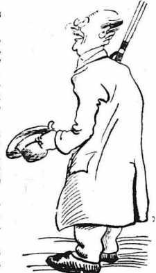
— Έλαίξω, είπεν ό Πιό έφραξε ό ι σήμερα δεν θ' άπαγγελλόμε μόνον θανατικά ποινές, αλλά θα ανάλάβουμε και την εκτέλεσόν τους

— Αν θέλης να λάβης πιο καλή συμβουλή, μή σσκήτης τον φίλο σου. Ράψης τον έχθρό σου και πάνε τό αντίθετο από ότι θα σά συμβουλεύση.