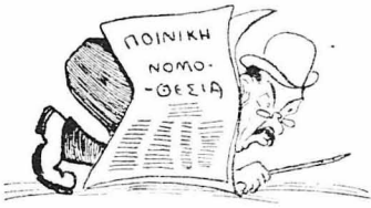
Πίσω από μια ποινική δικαστήρια

Η έ πηλη όμωσ των έπαρχιακών δεν ήταν γιατί οι κύρι δικαστές θα παρβρίζαν τους νόμους και τις διαταγές που ήταν «έντετακτρών» να έφερρόζονταν. Τεταίο πράγμα δεν άνασάχησε ποτέ την σκέψη των έλληνων! Οι νόμοι, οι έχθροι του πολιτείας στην Ελλάδα. Έγιναν για να παρβριόζωνται και ό παρβριότης ό «έχθρος έλληνας» άπάντα!