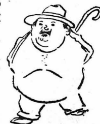
«Ήθελα νάμουν αγρόχορος, είπεν ό Δήμαρχος.