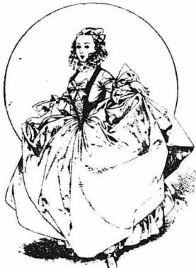
"Όμορφη και χαριτωμένη".