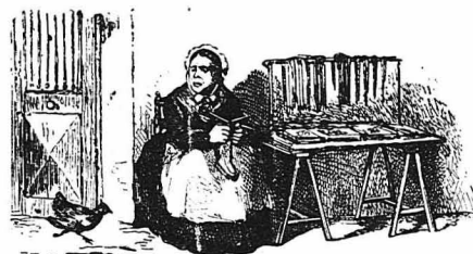
‘Ηταν χοντρή σαν βαρέλα!...

μέρες τραπηθήκαν κι’ έχώρισαν, έχθροί παιδιά άσπονδοί. ‘Έτσι πειρά ή γρηά ζήσε μόνη της. Με τούς Γκιγιώ τήν χάρισε μίσος λυσσώδες. Και μόνον ένα τέτοιο γεγονός—σαν κι’ αυτό που πριν από λίγο είχε άναγγείλει ή γρηά Φελισή—μπορούσε να φέρη τούς Γκιγιώ κοντά στη θεία Κατερίνα.